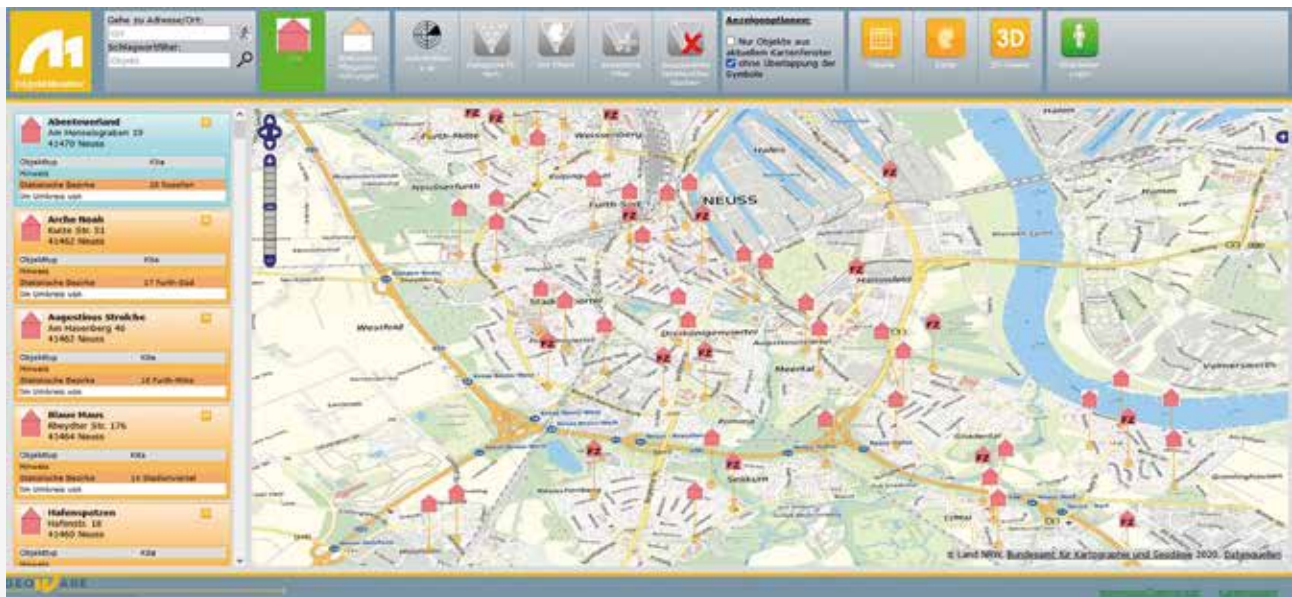
Sozialatlas Stadt Neuss – KITAS in der Kartenansicht

auch, Daten grafisch aufzubereiten und visuell, flächenbezogen in Kartenform über das gesamte Stadtgebiet darzustellen. Dies geschieht im „Sozialatlas“, in einer webbasierten Plattform, die sowohl eine tabellarische als auch eine georeferenzierte Darstellungsform ermöglicht.