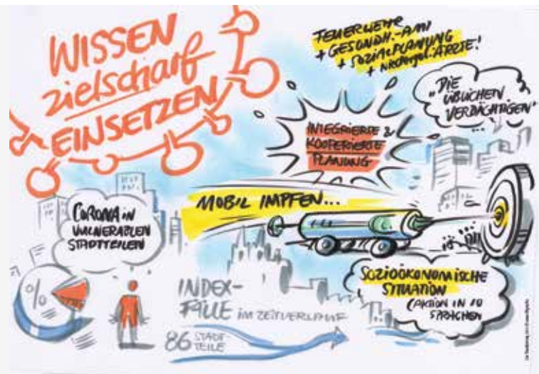
live Visualisierung © Christoph Illigens

Strategische Planung und Sozialraum- koordinator*innen als Scharnier zwischen Verwaltung und Sozialraum