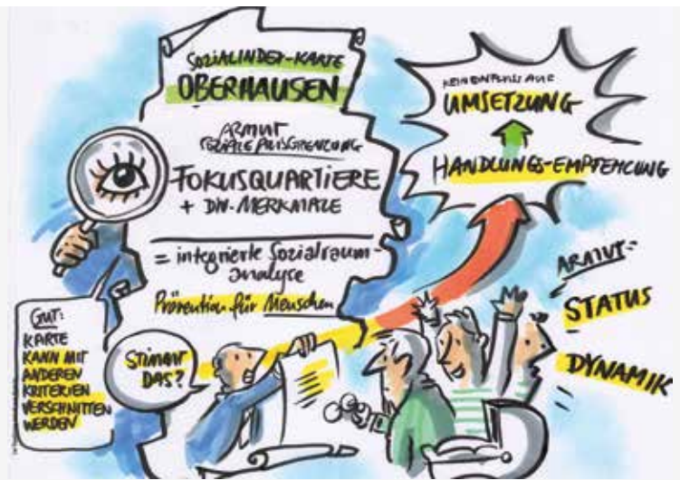
live Visualisierung

Integrierte Sozialraumanalyse für eine zukunftsfähige Stadtentwicklung