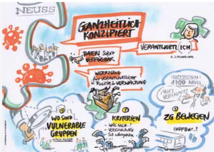
live Visualisierung

Beim Hochwasserereignis in Nordrhein-Westfalen im Juli 2021 orientierte sich die Stadt Neuss an der „Hochwassergefahrenkarte Erft“, die von den Bezirksregierungen Düsseldorf und Köln in Kooperation mit dem Erftverband zur Verfügung gestellt wurde. Mithilfe der Karte, die zusätzlich vorlag, und dem Sozialatlas, der zahlreiche Einrichtungen, wie zum Beispiel Alten- und Pflegeheime, enthielt, ließen sich durch einen schnellen Abgleich hochwassergefährdete Einrichtungen und Objekte ausweisen. Gleichzeitig konnten so auch ungefährdete Gebiete und somit Standorte für Notunterkünfte bei eventuellen Evakuierungen gefunden werden. Die Verwaltung konnte durch diesen Vergleich sehen, welche Einrichtungen, auch die in nicht „sozialer“ oder städtischer Trägerschaft, in gefährdeten Gebieten positioniert sind. So konnte beispielsweise umgehend auch der Neusser Kinderbauernhof, auf dem zahlreiche Tiere gehalten werden, sehr frühzeitig informiert werden. Hier ist der Faktor der frühzeitigen Information im Rahmen der Krisenprävention und Kriseninteraktion hilfreich. „Ein Werkzeug, das im Alltag vielfältig einsetzbar ist, und durch ebenfalls verfügbare Umkreisfilter auch genutzt werden kann, um Erreichbarkeiten abzuschät-